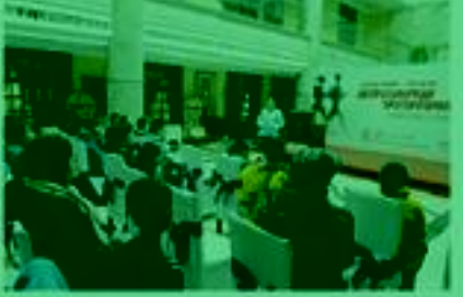
小记者们在活动现场。